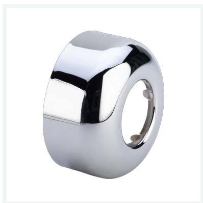
Rosette Modell 5711-545