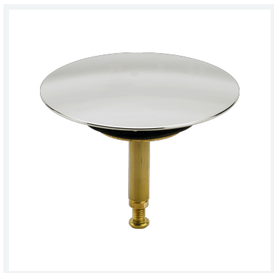
Ventilkegel - für Multiplex, Multiplex Trio Modell 6168-035