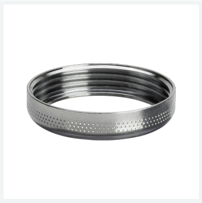
Überwurfmutter Modell 1325V-654