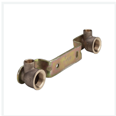
Gemini-Montageeinheit Modell 94476.0 Artikel 101 091