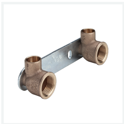
Gemini-Montageeinheit Modell 94476.2 Artikel 107 284