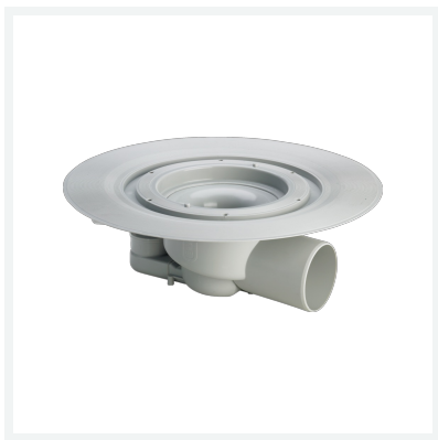
Advantix-Bodenablauf-Grundkörper Modell 4955.15 Artikel 285 050