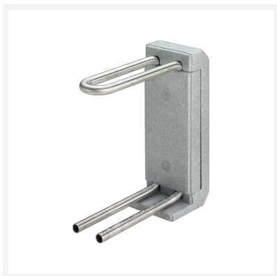
Heizkörperanschlussblock Modell 1097.6 Artikel 364 045