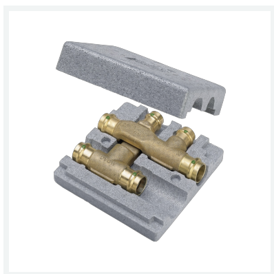
Sanpress-Kreuzungs-T-Stück mit SC-Contur Modell 2249.3 Artikel 493 325