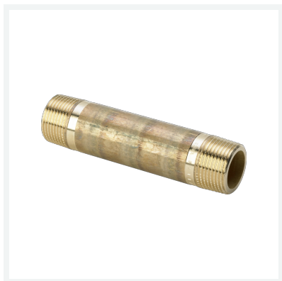
Langnippel - R-Gewinde Modell 3530