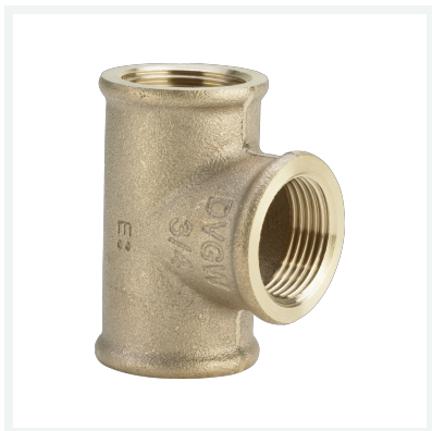
T-Stück Modell 3130 Artikel 264 284