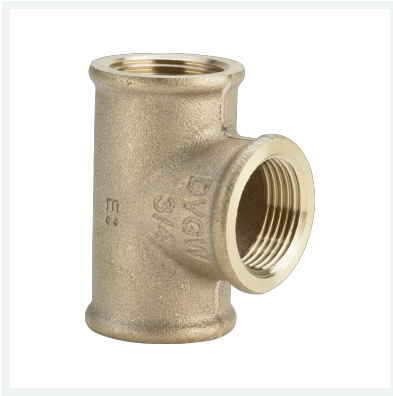
T-Stück - Rp-Gewinde Modell 3130