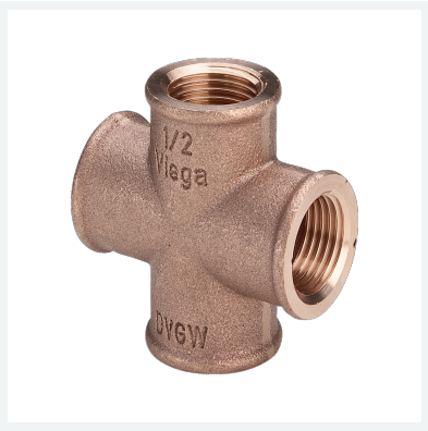
Kreuzstück - Rp-Gewinde Modell 3180 Artikel 320 638