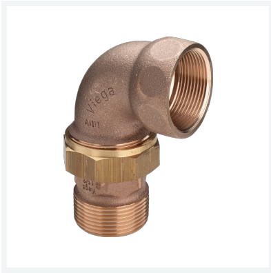
Verschraubung Modell 3088 Artikel 348 663