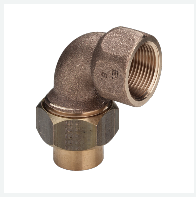
Übergangsverschraubung 90° Modell 94096G Artikel 114 787