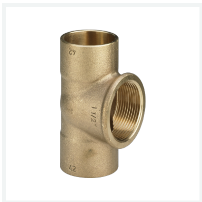
T-Stück Modell 94130G Artikel 102 401