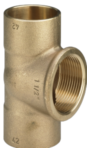
T-Stück - Lötanschlüsse, Rp-Gewinde Modell 94130G