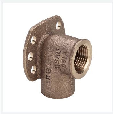
Wandscheibe - Lötanschluss, Rp-Gewinde Modell 94471G