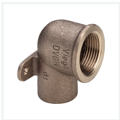
Wandscheibe Modell 94472G Artikel 100 223