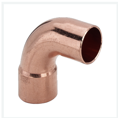
Bogen 90° - Lötanschluss, Einsteckende Modell 95001A