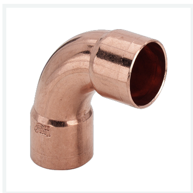
Bogen 90° - Lötanschluss Modell 95002A