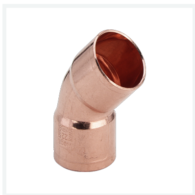
Bogen 45° - Lötanschluss Modell 95041