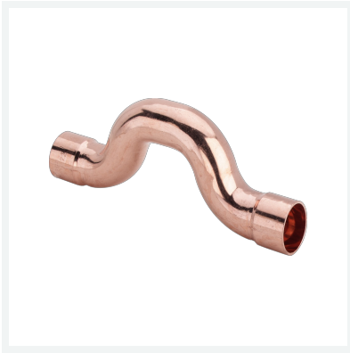
Überbogen - Lötanschluss Modell 95085