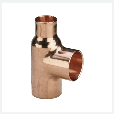
T-Stück Modell 95130 Artikel 110 819