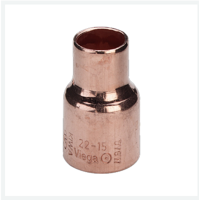
Reduziermuffe - Lötanschluss Modell 95240