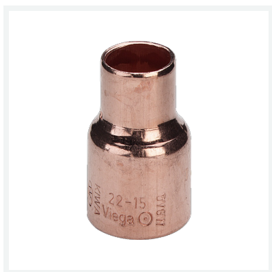
Reduziermuffe - Lötanschluss Modell 95240