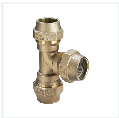
Maxiplex-T-Stück Modell 9051 Artikel 276 119