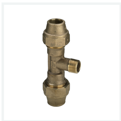
Maxiplex-T-Stück Modell 9052 Artikel 275 266