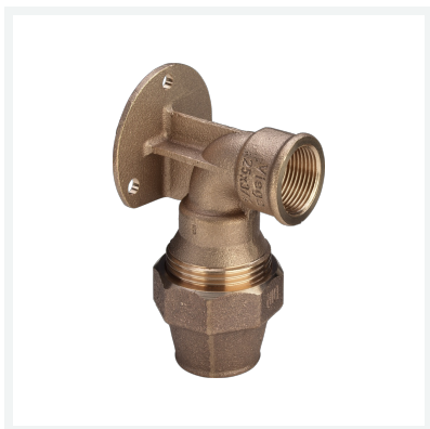
Maxiplex-Wandscheibe Modell 9025.5 Artikel 278 021