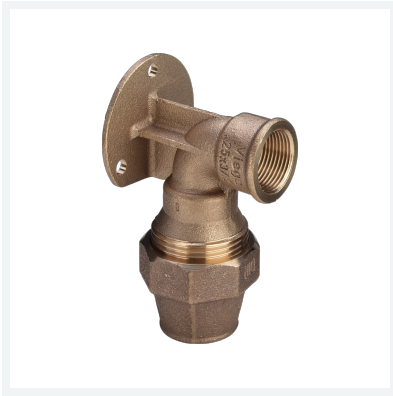
Maxiplex-Wandscheibe Modell 9025.5 Artikel 277 734