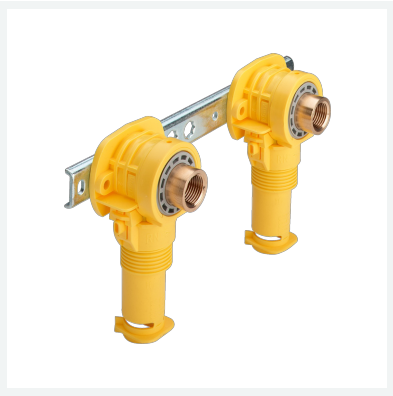
Sanfix P-Montageeinheit mit SC-Contur Modell 2121.01 Artikel 302 818