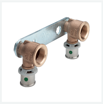
Sanfix P-Montageeinheit mit SC-Contur Modell 2124.2 Artikel 310 622