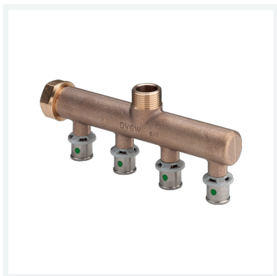
Sanfix P-Verteiler mit SC-Contur Modell 2126.05 Artikel 309 268