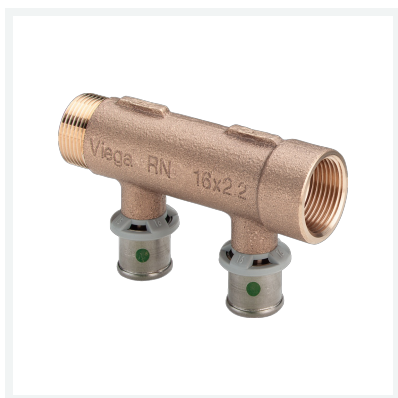
Sanfix P-Verteiler mit SC-Contur Modell 2126.06 Artikel 309 237