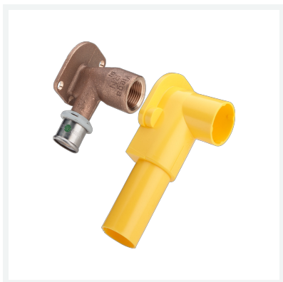
Sanfix P-Wandscheibe mit SC-Contur Modell 2125.3 Artikel 303 679