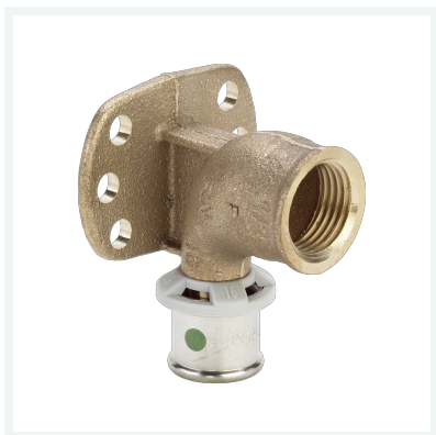
Sanfix P-Wandscheibe mit SC-Contur - Pressanschluss, Rp-Gewinde Modell 2125.5