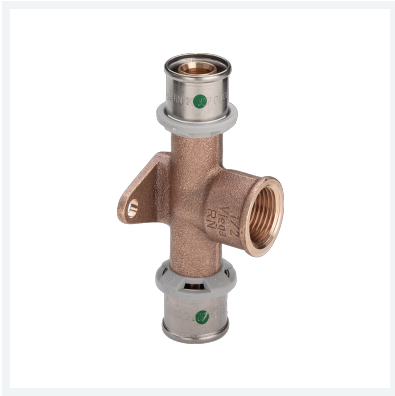
Sanfix P-Wandscheiben-T-Stück mit SC-Contur Modell 2125.8 Artikel 303 105