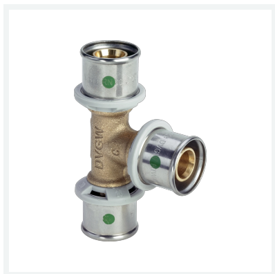
Sanfix P-T-Stück mit SC-Contur - Pressanschlüsse Modell 2118