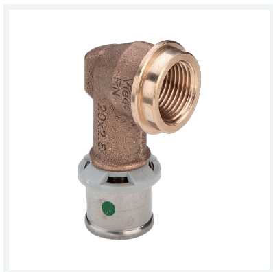
Sanfix P-Übergangsbogen 90° mit SC-Contur - Pressanschluss, Rp-Gewinde Modell 2114.11