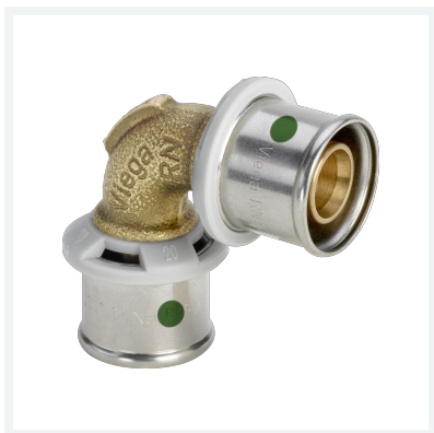
Sanfix P-Bogen 90° mit SC-Contur - Pressanschlüsse Modell 2116