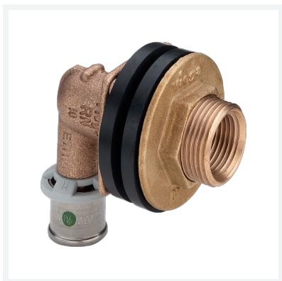
Sanfix P-Wanddurchführung mit SC-Contur Modell 2132.11 Artikel 310 738