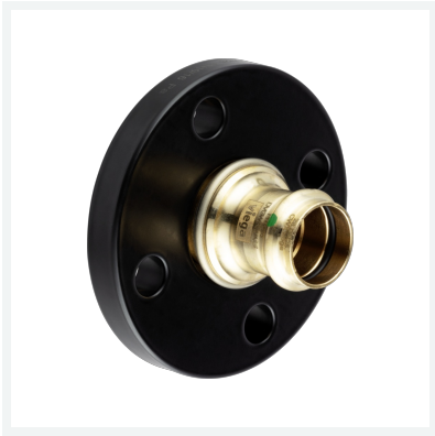
Sanpress-Flanschübergang mit SC-Contur Modell 2259.5 Artikel 479 879