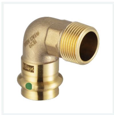
Sanpress-Übergangsbogen 90° mit SC-Contur Modell 2214 Artikel 197 988