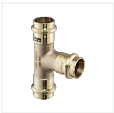
Sanpress-T-Stück mit SC-Contur Modell 2218 Artikel 199 364