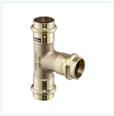
Sanpress-T-Stück mit SC-Contur Modell 2218 Artikel 281 397