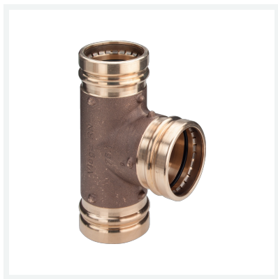
Sanpress XL-T-Stück mit SC-Contur Modell 2218XL Artikel 350 628