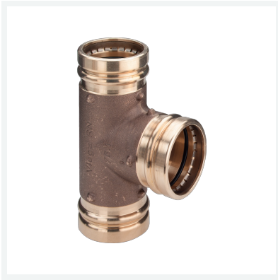
Sanpress XL-T-Stück mit SC-Contur Modell 2218XL Artikel 350 635