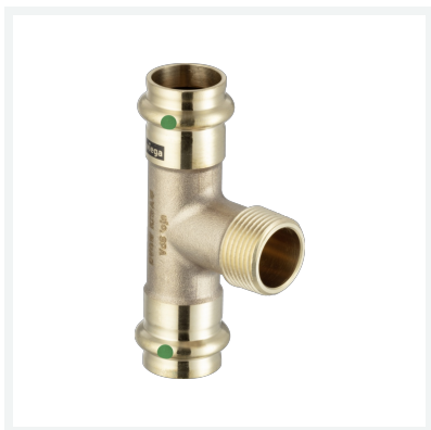
Sanpress-T-Stück mit SC-Contur Modell 2217.1 Artikel 194 147