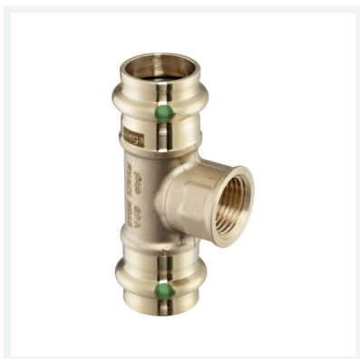
Sanpress-T-Stück mit SC-Contur Modell 2217.2 Artikel 197 353