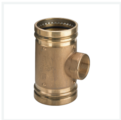
Sanpress XL-T-Stück mit SC-Contur Modell 2217.2XL Artikel 354 589