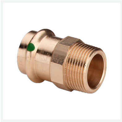
Sanpress-Übergangsstück mit SC-Contur Modell 2211 Artikel 287 764