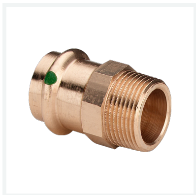
Sanpress-Übergangsstück mit SC-Contur Modell 2211 Artikel 287 771